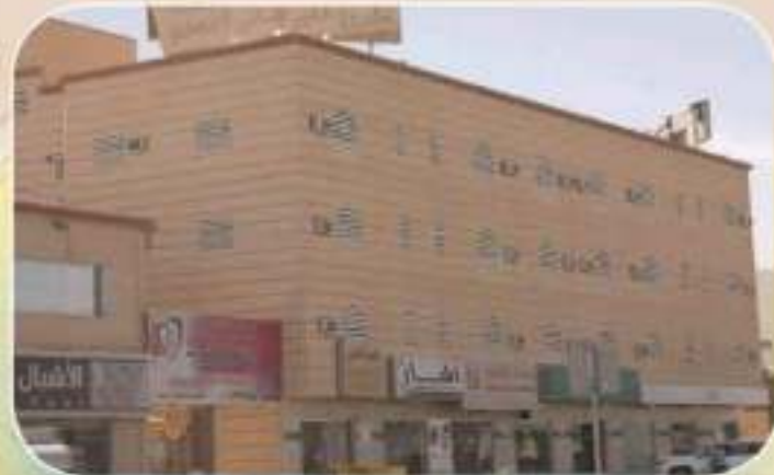
مبنى الخير السكني على طريق الملك عبد الله