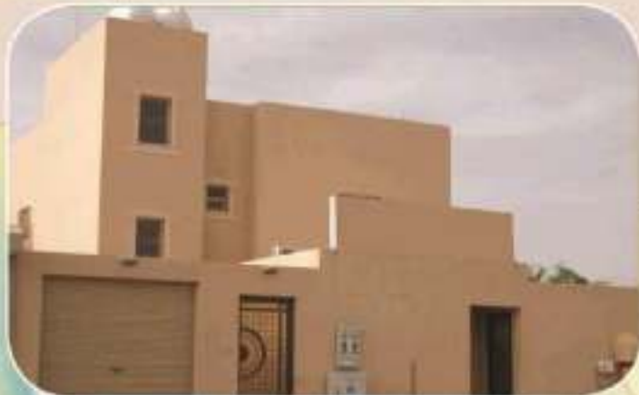
مبنى حي القادسية