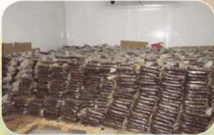
استقبال زكاة التمور وضمدتها ثم توزيعها