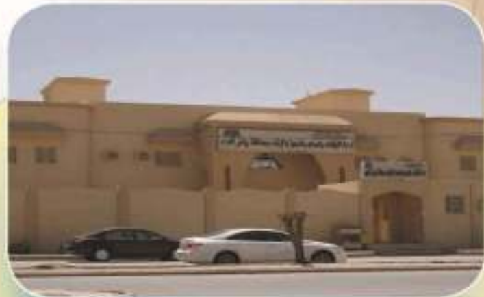
مبنى إدارة الأوقاف طريق الإسكان حي التعاون