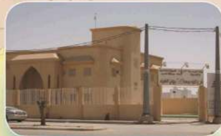
مبنى فرع المياه طريق الإسكان حي التعاون