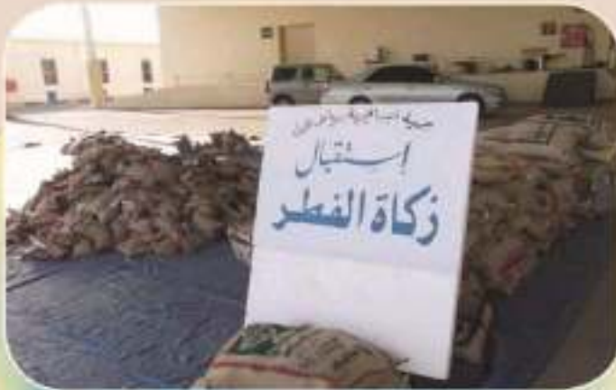
استقبال وتوزيع زكاة الفطر