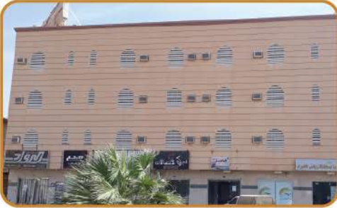
مبنى الخير السكني على طريق الملك عبدالله ومقر إدارة جمعية البر الخيرية