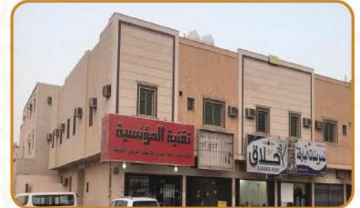
مبنى المؤسسية ( الرياض )