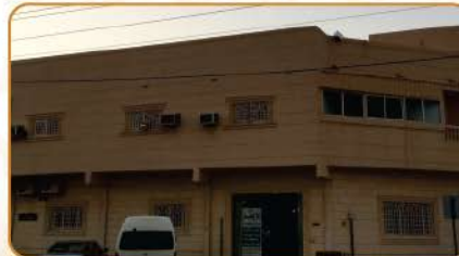
مبنى على طريق الملك عبدالعزيز