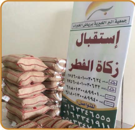
استقبال وتوزيع زكاة الفطر