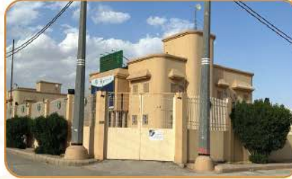
مبنى مكتب وزارة البيئة والمياه والزراعة