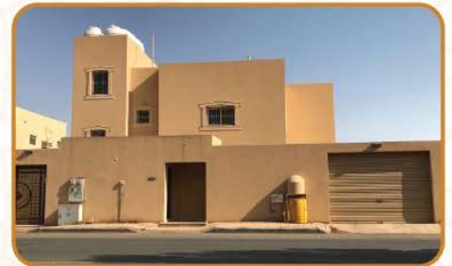
مبنى حي القادسية