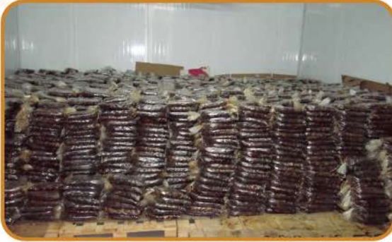
استقبال زكاة التمور وضمدتها ثم توزيعها

تقوم الجمعية بتوزيع السلال الغذائية على المستفيدين ومن ضمنها السلة الرمضانية