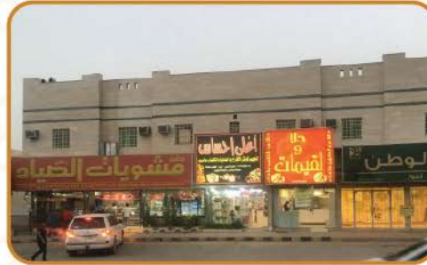
عمارة حي الخليج بالرياض