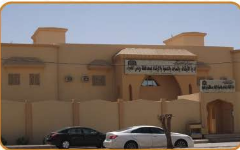
مبنى إدارة المساجد والدعوة والإرشاد